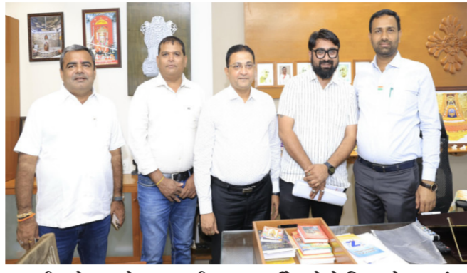
સત્તાવી રહેલા સ્ટેમ્પ ડ્યૂટીના ગંભીર પ્રશ્ન, પ્લોટ નં. ૯૦ ના સર્વિસ ચાર્જને લગતો વણઉકલાયેલો વિવાદ તેમજ લાંબા સમયથી પડતર એવી રેસિડેન્શિયલ ઝોનને ઇન્ડસ્ટ્રીયલ ઝોનમાં કન્વર્ટ