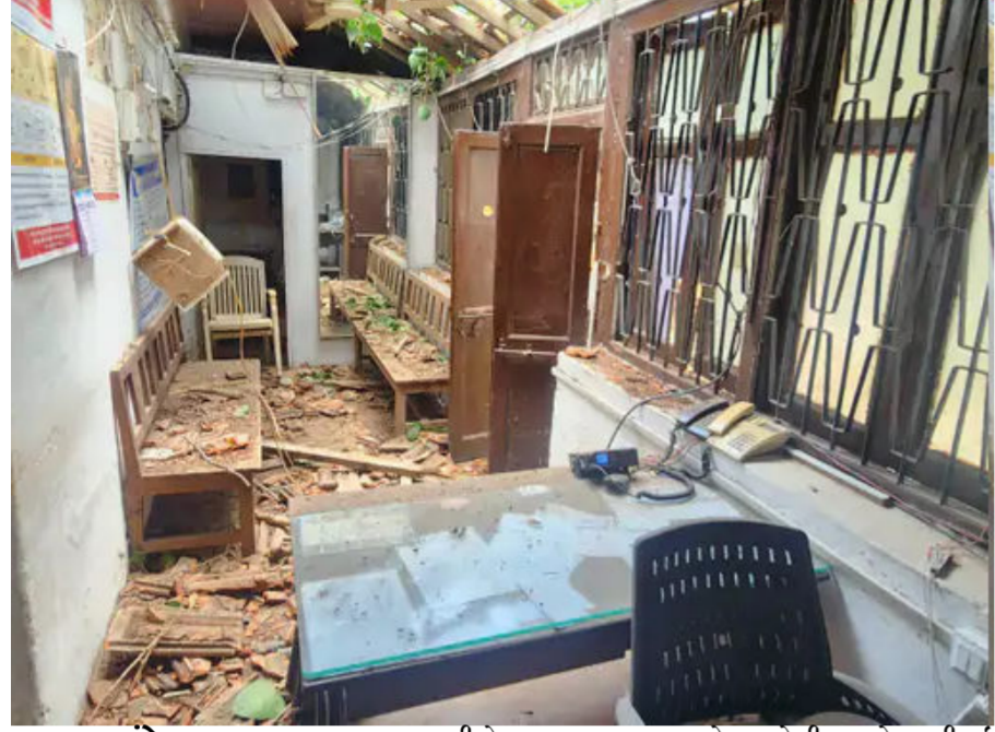
સમય સંદેશ: જામનગર જામનગર શહેરની એસપી કચેરીના કમ્પાઉન્ડમાં આવેલા મહિલા પોલીસ સ્ટેશન પર આજે એક વિશાળ વૃક્ષ ધરાશયી થયું હતું.

સદનસીબે, આ ઘટના સમયે પોલીસ સ્ટેશનમાં કોઈ સ્ટાફ કે અરજદાર હાજર ન હોવાથી મોટી જાનહાનિ ટળી હતી. જે સમયે આ મહાકાય વૃક્ષ