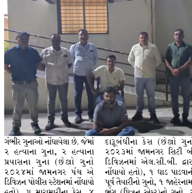
ગંભીર ગુનાઓ નોંધાયેલા છે. જેમાં ૨૦૨૩માં જામનગર સિટી બી ડિવિઝનમાં એલ.સી.બી. દ્વારા નોંધાયેલો હતો, ૧ ઘાડ પાડવાની પૂર્વ તૈયારીનો ગુનો, ૧ જાહેરનામા ભંગ (પ્રિઝન એક્ટ)નો ગુનો, ૨