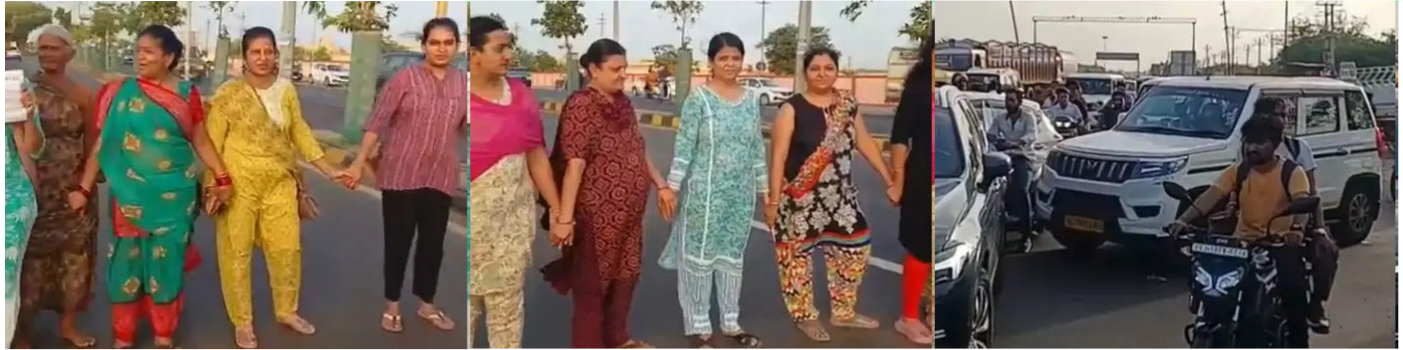
સમય સંદેશ: જામનગર

જામનગરમાં પ્રાથમિક સુવિધાઓ અને પાણીની તંગીથી પરેશાન મહિલાઓએ આજે રોષ વ્યક્ત કર્યો હતો. શહેરની ન્યૂ જામનગર સોસાયટીની મહિલાઓએ તંત્ર અને સ્થાનિક કોર્પોરેટરોના ઉદાસીન વલણ સામે વિરોધ પ્રદર્શન કર્યું હતું. તેમણે જામનગર-ખંભાળિયા