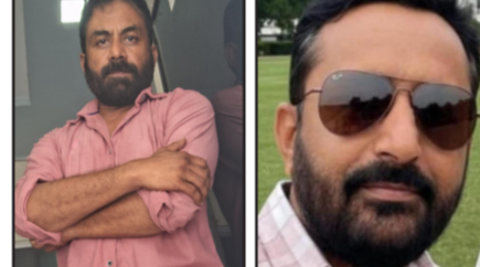
કર્મચારીઓ કરાર આધારિત આઉટસોર્સિંગ કર્મચારીઓ આ પી.એમ. પોષણ યોજના ની મહારેલીમાં બેઠાવવા હાકલ કરવામાં આવી છે. પી.એમ. અને શુક્રવારે જામખંભાળિયા બસ સ્ટેન્ડની બાજુમાં સોરઠીયા વાણંદ સમાજની વાડી ખાતે સવારે ૧૦ વાગ્યે ભવ્ય મીટિંગનું આયોજન સાંજે ૫:૦૦ વાગ્યા સુધી કરવામાં આવેલ છે. સાથે સાથે મહારેલીનું પણ આયોજન કરવામાં આવેલ છે.

સમય સંદેશ: ખંભાળિયા દ્વારકા જિલ્લા ના કલેક્ટરને આવેદન પાઠવવા સહિતના કાર્યક્રમો પગાર વધારા સહિતના પ્રશ્નોની માંગણી કરવામાં આવશે. આ મહારેલીમાં ગુજરાતના પી.એમ. પોષણ શક્તિ નિર્માણ આયોજના અંતર્ગત સંચાલકો રસોઈયા, મદદનીશ નો હિત ઈચ્છતા હોય એવા સંગઠોના આગેવાનો પછી આશા વકર , આંગણવાડી વકર તમામ એસ.એસ.ના આગેવાનો તથા