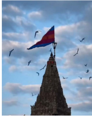
સમય સંદેશ: દ્વારકા પવિત્ર પુરુષોત્તમ માસના ઉત્તરાર્ધમાં શ્રદ્ધાળુઓની સતત વધી રહેલી સંખ્યાને ધ્યાનમાં રાખીને દ્વારકાધીશ જગત મંદિર ખાતે દર્શન