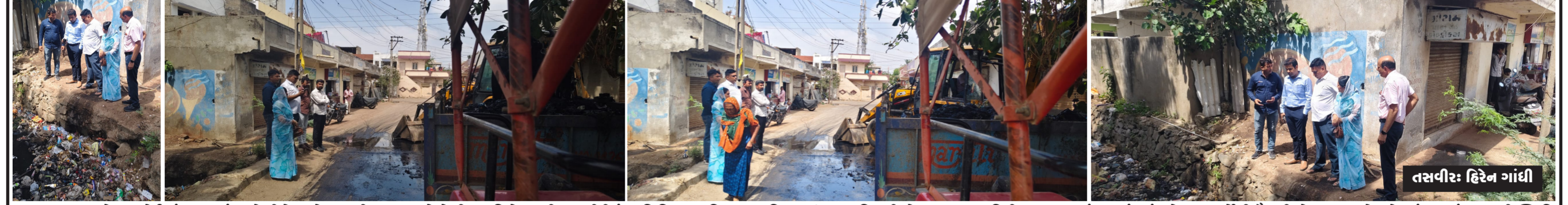
જામનગર શહેરના વોર્ડ નંબર ૬ માં આવેલી મેઈન કેનાલની સફાઈ અને તેની પ્રગતિ હેઠળની કામગીરીનું મ્યુનિસિપલ કમિશનર સહિતના ઉચ્ચ અધિકારીઓ દ્વારા સઘન નિરીક્ષણ કરવામાં આવ્યું હતું. ચોમાસા પૂર્વેની તૈયારીઓના ભાગરૂપે શહેરમાં જળબંબાકારની સ્થિતિ ન સર્જાય તે માટે વહીવટી તંત્ર દ્વારા આ નિરીક્ષણ હાથ ધરાયું હતું, જેમાં કમિશનરશ્રીએ કામગીરીને વધુ ઝડપી અને ગુણવત્તાયુક્ત બનાવવા માટે સંબંધિત અધિકારીઓને જરૂરી સૂચનો અને માગદર્શન પૂરું પાડ્યું હતું. આ અગત્યની સમીક્ષા મુલાકાત દરમિયાન સ્થાનિક કોર્પોરેટરશ્રી પણ કમિશનર અને ઉચ્ચ અધિકારીઓની ટીમ સાથે ખાસ હાજર રહ્યા હતા અને વિસ્તારની ભૌગોલિક સ્થિતિ તેમજ સ્થાનિક રજૂઆતોથી તંત્રને માહિતગાર કર્યું હતું.