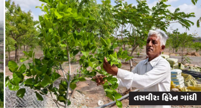
તેમને પર્યાવરણ પાછળ જીવન પ્રથમ થોડા વૃક્ષો વાવી શરૂઆત વિતાવવાનો વિચાર આવ્યો હતો. કર્યા બાદ આજ સુધીમાં તેઓએ

૨૫ હજાર વૃક્ષ વાવીને સતત સફાઈ પાણી પીવાડાવવા સહિતના કામ કરી જગ્યાને ગાઢ જંગલમાં ફેરવી નાખી છે. આ ૨૫ હજાર વૃક્ષોને તેઓ પોતાનો સંસાર માને છે અને સવારથી સાંજ સુધી મોટાભાગનો સમય અહીં પસાર કરે છે. એટલું જ નહીં પ્રકૃતિના પ્રતાપે હાલ તેમની અલ્સર સહિતની બીમારી પણ દૂર થઈ ગઈ હોવાનો તેઓ દાવો કરે છે. ચોમાસામાં આ જગ્યા સોળે કળાએ ખીલી ઉઠી છે અને લોકો