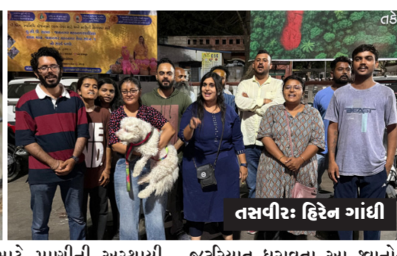
શ્વાનો માટે પાણીની અસ્થાયી વ્યવસ્થા કરવામાં આવી હતી, પરંતુ કાયમી ઉકેલ ન આવતાં મૂંગા પશુઓની પીડા યથાવત છે. સર્જરી બાદ પોષણની

ગંભીર બેદરકારી દાખવવામાં આવી રહી છે તેમજ કેન્દ્રમાં મૃત્યુ પામતા શ્વાનોનો કોઈ પરદર્શક રેકોર્ડ રાખવામાં આવતો નથી. આ સાથે જ સુપ્રીમ કોર્ટ અને એનિમલ વેલફેર બોર્ડની ગાઈડલાઈન મુજબ શ્વાનને જે વિસ્તારમાંથી પકડવામાં આવ્યા હોય ત્યાં જ પરત છોડવાના બદલે અન્ય વિસ્તારોમાં છોડી દેવાતા હોવાની ઘટનાઓ પણ સામે આવી છે, જેના કારણે સ્થાનિક શ્વાનો સાથેના ઝઘડામાં અબોલ જીવો ઇબ્રાહિમ કે મૃત્યુ પામે છે. આ સમગ્ર અમાનવીય વર્તનના વિરોધમાં જીવદયા પ્રેમીઓએ લાલ બંગલા સર્કલ ખાતે એકત્ર થઈને સૂત્રોચ્ચાર સાથે ઉગ્ર વિરોધ પ્રદર્શન કર્યું હતું. તેમજ મહાનગરપાલિકા, જિલ્લા વહીવટીતંત્ર અને પ્રાણી કલ્યાણ બોર્ડ સમક્ષ આ મામલે તટસ્થ ઉચ્ચસ્તરીય તપાસ કરાવેલી દોષિત એજન્સી સામે કડક કાર્યવાહી કરવાની અને શ્વાનોને તુરંત યોગ્ય ખોરાક, પાણી તથા તબીબી સારવાર આપવાની માંગ કરી છે.