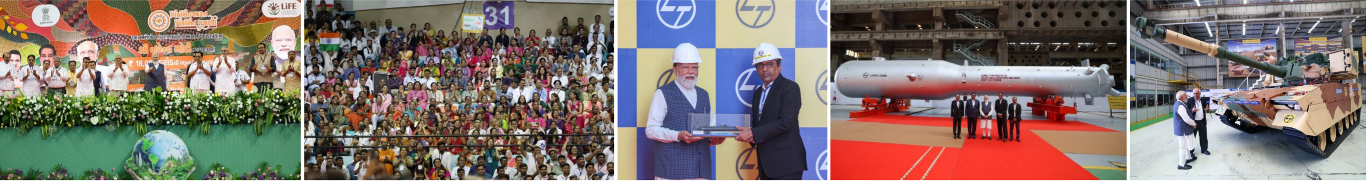
વડાપ્રધાન નરેન્દ્ર મોદીએ સુરતની મુલાકાત લઈને દક્ષિણ ગુજરાતના ૭ જિલ્લાઓ માટે રૂ. ૧૮,૭૭૮ કરોડના ખર્ચે ૨૪ જેટલા વિવિધ વિકાસ પ્રકલ્પોનું લોકાર્પણ અને ખાતમુહૂર્ત કર્યું હતું. તેમણે હજીર સ્થિત કા પ્લાન્ટમાં 'મેક ઇન ઇન્ડિયા' હેઠળ સંરક્ષણ અને ગ્રીન એનર્જી પ્રોજેક્ટ્સનું નિરીક્ષણ કર્યું, અને બાહર સભામાં "વિકસિત ગુજરાત, વિકસિત ભારત"નો સંકલ્પ દોહરાવતા સુરતની જન-ભાગીદારી વાળી સફાઈ ઝુંબેશની મુક્તમને પ્રશંસા કરી હતી. મુખ્યમંત્રી ભૂપેન્દ્ર પટેલે પણ પર્યાવરણીય પડકારોને અવસરમાં બદલવાના ગુજરાતના અગ્રેસર પ્રયાસો અને દેશની પ્રથમ સોલાર નીતિઓનો ઉલ્લેખ કરીને વડાપ્રધાનના વૈશ્વિક નેતૃત્વ પર ગૌરવ વ્યક્ત કર્યું હતું.