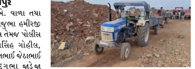
હતા. જેમાંથી ચાર ટ્રોલીમાં બ્લેક ટ્રેપના પથ્થરો ભરેલા હતા, બ્યારે બે ટ્રેક્ટર ખનન ભરવા માટે તૈયાર હાલતમાં ઉભા હતા. પોલીસે તાત્કાલિક ખોદકામની કામગીરી બંધ કરાવી અને હાજર લોકોને ખનન માટે જરૂરી રોયલ્ટી, પાસ પરમિટ અથવા ખાણ ખનીજ વિભાગની મંજૂરી અંગે પૂછપરછ કરી હતી. બેંકે, કોઈપણ વ્યક્તિ જરૂરી દસ્તાવેજો કે કાયદેસર મંજૂરી રજૂ કરી શકી નહોતી. આથી પોલીસે સ્થળ પરથી ખનન, મશીનો અને વાહનો