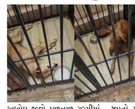
અબોલ જીવો કાળજાળ ગરમીમાં તરસથી વ્યાકુળ બની તરફડી રહ્યા હતા. જીવદયા કાર્યકરોએ કેન્દ્ર પર જઈને ભારે વિરોધ પ્રદર્શન કર્યા બાદ તંત્ર દ્વારા તાત્કાલિક ટેન્કર મંગાવીને

સમય સંદેશ: જામનગર જામનગર મહાનગરપાલિકા સંચાલિત શ્વાન ખસીકરણ કેન્દ્રમાં શ્વાનોની અત્યંત દયનીય અને ચિંતાજનક સ્થિતિ સામે આવતાં શહેરના જીવદયા અને શ્વાનપ્રેમીઓમાં ભારે રોષ ફેલાયો છે. ખાનગી એજન્સીને સોંપાયેલા આ કેન્દ્રમાં આશરે ૧૦૦ જેટલા શ્વાનો રાખવામાં આવ્યા છે, બ્યાં તેમને પૂરતો ખોરાક અને પીવાનું પાણી ન મળતું હોવાના આક્ષેપો થયા છે. છેલ્લા કેટલાક દિવસોથી પાણીની મોટર બંધ હોવાના કારણે