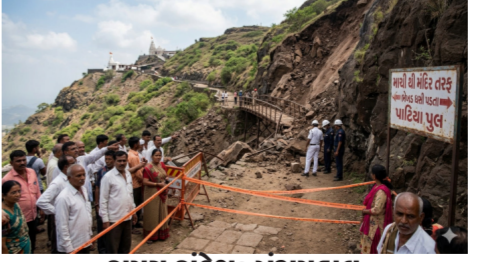
સમય સંદેશ: પંચમહાલ

સમય સંદેશ: પંચમહાલ પવિત્ર યાત્રાધામ પાવાગઢમાં શુક્રવારે એક ગમખવાર દુર્ઘટના સર્જાઈ. મારીથી ડુંગર તરફ જતાં પાટિયા પુલ નજીક અચાનક ભેખડ ધસી પડતા પગથિયા પર જઈ રહેલા શ્રદ્ધાળુઓ તેની નીચે દબાઈ ગયા હતા. આ દુર્ઘટનામાં બે શ્રદ્ધાળુના ઘટનાસ્થળે મોત થયા છે. જ્યારે ચાર લોકો ગંભીર રીતે ઘાયલ થયા છે. આ દુર્ઘટના વહેલી સવારે પાંચ વાગ્યા આસપાસ બની હતી. મુસાફરો પર પથ્થરો પડવાની આ ઘટનાની બાજુ થતાં જ પાવાગઢના સરપંચ, સ્થાનિક પોલીસ પ્રશાસન, ફાયર બ્રિગેડ અને બચાવ ટુકડીઓ તાત્કાલિક અસરથી ઘટનાસ્થળે દોડી ગઈ હતી. રેસ્ક્યુ ટીમે ભારે જહેમત ઉઠાવીને પથ્થરો નીચે દબાયેલા તમામ યાત્રાળુઓને બહાર કાઢ્યા હતા. ઈબગ્રસ્તોને ૧૦૮ એમ્બ્યુલન્સ મારફતે હાલોલની સરકારી હોસ્પિટલમાં સારવાર અર્થે ખસેડવામાં આવ્યા હતા. બીજી તરફ, મુતક યાત્રાળુઓના શબોને કાયદેસરની કાર્યવાહી માટે પોસ્ટમોર્ટમ અર્થે મોકલી આપ્યા. હોસ્પિટલના સૂરોના જણાવ્યા મુજબ, કુલ ૪ ઈબગ્રસ્તોમાંથી ૨ લોકોને સામાન્ય ઈબઓ હોવાથી પ્રાથમિક સારવાર આપીને રબ આપી દેવામાં આવી છે, જ્યારે બાકીના ૨