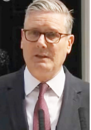
સમય સંદેશ: કેરક બ્રિટિશ રાજકારણમાં મોટી ઉત્થલાપાથલ થઈ છે. શાસક લેબર પાર્ટીના ૧૦૦ થી વધુ સાંસદોની નારાજગી બાદ, કીર સ્ટાર્મરના વડા

પ્રધાન તરીકે ચાલુ રહેવા અંગે શંકાઓ ઉભી થઈ હતી. છેલ્લા કેટલાક દિવસોથી એવી વ્યાપક ચર્ચા ચાલી રહી હતી કે તેઓ રાજીનામું આપી શકે છે. હવે, સ્ટાર્મરે રાજીનામાની જાહેરાત કરી છે. કીર સ્ટાર્મરે સોમવારે એક પ્રેસ કોન્ફરન્સમાં રાજીનામાની જાહેરાત કરી. કીર સ્ટાર્મરે એમ પણ કહ્યું કે તેઓ વડા પ્રધાન તેમજ લેબર પાર્ટીના નેતા તરીકે રાજીનામું આપશે. સ્ટાર્મરે એમ પણ કહ્યું કે તેઓ નવા વડા પ્રધાનને સંપૂર્ણ સમર્થન અને સહયોગ આપવાનું ચાલુ રાખશે. કીર સ્ટાર્મરના રાજીનામાની જાહેરાત સાથે, હવે એ વાત નિર્ણય થઈ ગઈ છે કે લેબર પાર્ટી આગામી સંસદીય ચૂંટણીઓ નવા ચહેરા સાથે લડશે.