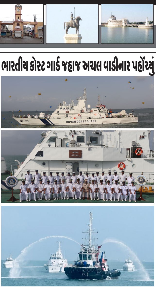
ભારતીય કોસ્ટ ગાર્ડ જહાજ અચલ વાડીનાર પહોંચ્યું