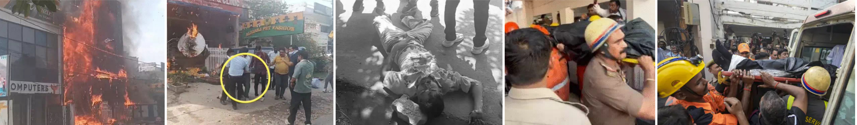
ઉત્તર પ્રદેશના લખનૌના અલીગંજના પુરાનિયા વિસ્તારમાં એક ઇમારતના ગ્રાઉન્ડ ફ્લોર પર આવેલી પેટ શોપ અને ઉપરના માળે કાર્યરત ગેમિંગ ઝોનમાં લાગેલી ભીષણ આગમાં ૨૦ થી ૨૪ વર્ષની વયના ૧૫ લોકોના મોત થવાની પુષ્ટિ થઈ છે. ઘટના અંગે વરિષ્ઠ પોલીસ અધિકારીઓએ સ્પષ્ટતા કરી હતી કે શરૂઆતના અહેવાલોથી વિપરીત ઇમારતમાં કોઈ કોચિંગ સેન્ટર કે લાઈબ્રેરી નહોતી, પરંતુ ગેમિંગ ઝોનમાં કર્મચારીઓ સોફ્ટવેર પર કામ કરતા હતા. આગ લાગતા લોકોમાં ભારે ગભરાટ ફેલાયો હતો અને જીવ બચાવવા માટે એક વ્યક્તિ ઇમારત પરથી કૂદી પડતા તેને હોસ્પિટલ ખસેડાયો હતો, જ્યારે બાકીના ઇમારતના અન્ય લોકોને ફાયર, પોલીસ અને સ્થાનિકોની મદદથી સુરક્ષિત બહાર કાઢવામાં આવ્યા હતા. હાલમાં ફાયર ફાઈટરો દ્વારા આગ પર કાબૂ મેળવવા બાદ કુલિંગ કામગીરી ચાલી રહી છે, આ ઘટનાથી સુરતનો તક્ષશીલાકાંડ પુનઃ લોકોના મન પર અંકિત થયો છે, યાદ આવ્યો છે.