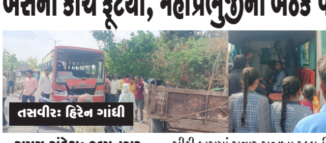
સમય સંદેશ: જામનગર જામનગર શહેરમાં મહાપ્રભુજીની બેઠક પાસે ગઈકાલે એક સીટી બસ અને ટ્રેક્કર વચ્ચે અકસ્માત થયો હતો. આ ઘટનામાં

અકસ્માત બાદ ઘટનાસ્થળે લોકોના ટોળા એકઠા થઈ ગયા હતા. ઈજાગ્રસ્ત વિદ્યાર્થીનીને તાત્કાલિક ૧૦૮ એમ્બ્યુલન્સ દ્વારા હોસ્પિટલ ખસેડવામાં આવી હતી. ૧૦૮ની ટીમે સ્થળ પર પ્રાથમિક સારવાર આપી હતી. સીટી બસના આગળના ભાગને નોંધપાત્ર નુકસાન થયું હતું અને તેનો મુખ્ય કાચ સંપૂર્ણપણે તૂટી ગયો હતો.