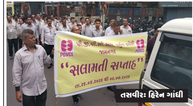
જામનગર જિલ્લામાં પીજીવીસીએલના વીજ અકસ્માતોને અટકાવવા સલામતી સપ્તાહ અંતર્ગત જનજાગૃતિ માટે વીજ સલામતી પદયાત્રા લાલ બંગલા કમ્પાઉન્ડ પીજીવીસીએલ ખાતે યોજાઈ હતી. આ રેલીમાં પીજીવીસીએલના અધિકારીઓ અને કર્મચારીઓ બોડાયા હતા અને લોકોને વીજ અકસ્માતો અટકાવવા અપીલ કરી હતી.