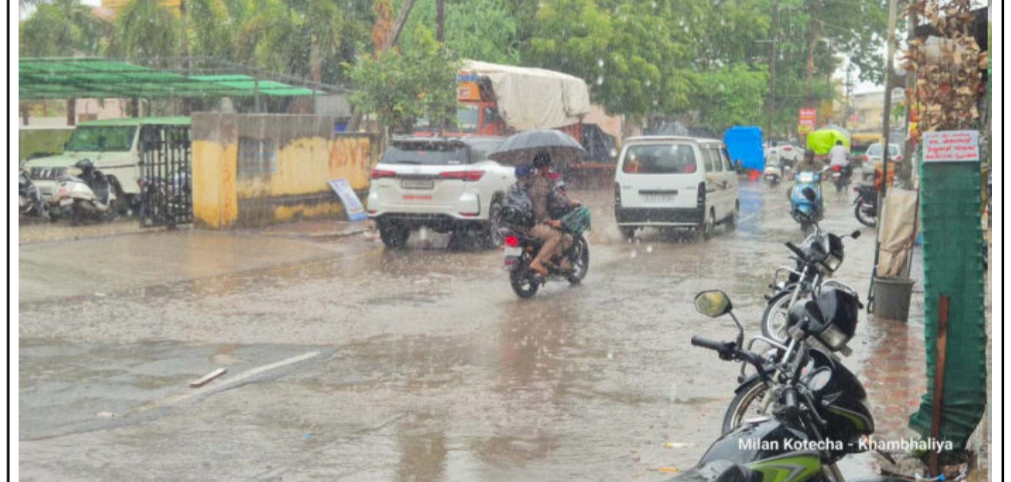
સમય સંદેશ, ખંભાળિયા દેવભૂમિ દ્વારકા જિલ્લામાં છેલ્લા બે દિવસથી જુદા જુદા વિસ્તારમાં હળવા વરસાદી ઝાપટા વરસી રહ્યા છે. આ વચ્ચે ખંભાળિયામાં ગઈકાલે શુક્રવારે આખો દિવસ ઘાબડિયું વાતાવરણ રહ્યું હતું અને દિવસ દરમિયાન અવારનવાર હળવા ઝાપટા વરસી ગયા હતા. ગઈકાલે એક દિવસમાં ૮ મી.મી. વરસાદ નોંધાયો છે. સતત વરસાદ છાંટાના પગલે રસ્તાઓ પણ કાદવ-કીચડનું સામાન્ય છવાયેલું રહ્યું હતું. આટલું જ નહીં, વરસાદી જીવાતના ઉપદ્રવથી નગરજનો ત્રસ્ત બન્યા હતા. આ સાથે ભાણવડ વિસ્તારમાં પણ ૧ મી.મી. વરસાદ નોંધાયો છે. આજે સવારે પણ મેઘાવી માલોલ વચ્ચે હળવા છાંટા વરસ્યા હતા. જો કે હજુ ધોધમાર વરસાદ ન વરસતા ખાસ કરીને ઘરતીપુત્રોમાં ચિંતાની લાગણી જોવા મળી રહી છે.