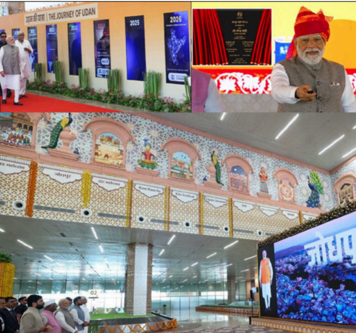
શેર-લેનિંગ કામકાજ. ચોર ઉર્જા અને પાવર ટ્રાન્સમિશન ક્ષેત્રના દેશને મજબૂત બનાવતા વિવિધ પ્રોજેક્ટ્સ. રાજસ્થાનના કાર્યક્રમો

સરકારના વિવિધ વિભાગોમાં નવનિયુક્ત ૫૪,૦૦૦ યુવાનોને પ્રતીકરૂપે નિમણૂક પત્રો પણ એનાયત કર્યા હતા. રાજધાની જયપુર માટે પણ આજનો દિવસ ઐતિહાસિક રહ્યો હતો, જેમાં પ્રધાનમંત્રીએ રૂપિયા ૧૩,૦૦૦ કરોડથી વધુના ખર્ચે બનનાર 'જયપુર મેટ્રો ફેઝ-૨' નો શિલાન્યાસ કર્યો હતો. આ ૪૧ કિલોમીટર લાંબો ઉત્તર-દક્ષિણ કોરિડોર શહેરના મુખ્ય રહેણાંક અને ઔદ્યોગિક વિસ્તારોને મેટ્રો નેટવર્કથી જોડશે. આ ઉપરાંત અન્ય માળખાકીય પ્રોજેક્ટ્સમાં નીચે મુજબના મહત્વના કાર્યો લોન્ચ કરાયા છે. ચુરુ-સાહુલપુર અને ચુરુ-રતનગઢ વચ્ચે ૧૦૪ કિલોમીટરના રેલવે લાઈન ડબલિંગ પ્રોજેક્ટ્સનું લોકાર્પણ. જોધપુર રિંગ રોડના કારવાર-ડાંગિયાવાસ વિભાગનું