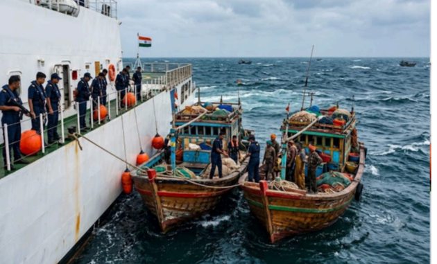
આવી છે. બેડી મરીન પોલીસે માછીમારોને પ્રતિબંધના સમયગાળા દરમિયાન દરિયામાં માછીમારી માટે ન જવા સૂચના આપી છે અને નિયમોનો ભંગ કરનાર સામે કડક કાર્યવાહી કરવામાં આવશે તેવી ચેતવણી પણ ઉચ્ચારી છે.