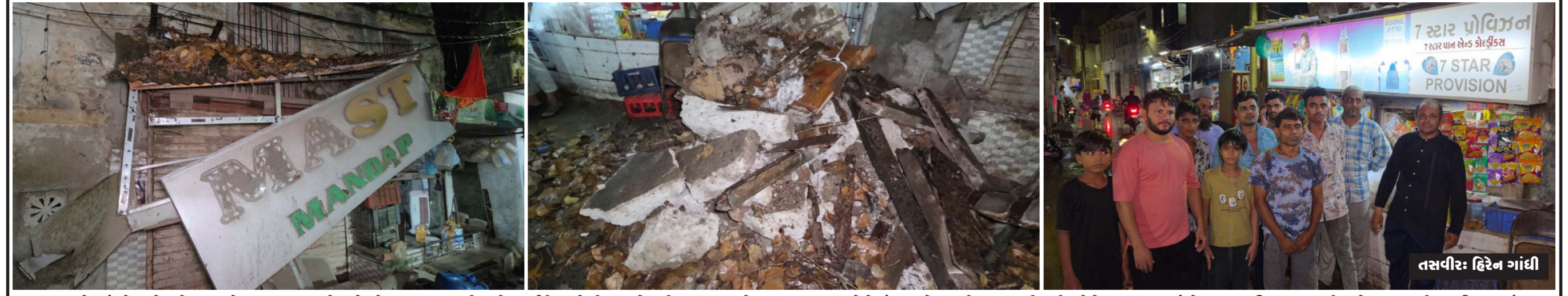
જામનગર શહેરમાં સોમવારે થયેલા ઘમાકેદાર વરસાદ થયો હતો. તે વરસાદ થવાની સાથે જર્જરીત હુસેનીબાગ હોલની છત ઘડાકાભેર ધરાશાય થતા લોકોમાં ભાગદોડ મચી જવા પામી હતી. જો કે આ બનાવમાં કોઈ જાનહાનિ થઈ ન હતી. શહેરના પટણીવાડ વિસ્તારમાં સદામ રેસ્ટોરન્ટ સામે હુસેનીબાગ હોલની ભયજનક અને જર્જરીત ઇમારતની છત ઘડાકાભેર તૂટી પડી હતી. જેને લઈને આસપાસના રહેતા લોકો ધરની બહાર દોડી આવ્યા હતા. તેમજ આ બનાવને લઈને લોકોના ટોળા એકત્ર થયા હતા. જો કે સદનશીલે કોઈ જાનહાનિ થઈ ન હતી.