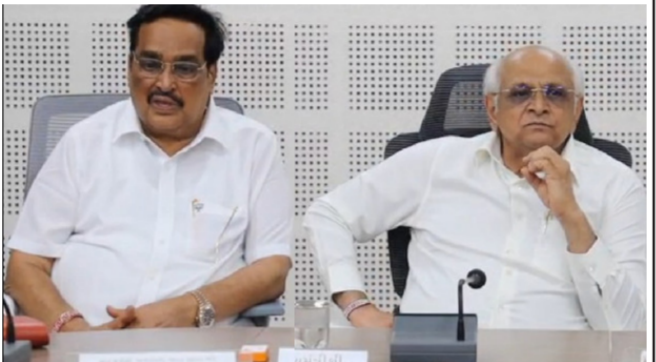
તારાજી સર્જાઈ છે. નવસારી કલેક્ટર કચેરી ખાતે મુખ્યમંત્રી ભૂપેન્દ્ર પટેલ અને કેન્દ્રીય જળ શક્તિ મંત્રી તેમજ નવસારીના સાંસદ સી. આર. પાટીલની સંયુક્ત અધ્યક્ષતામાં એક અનુ પાના નં. ૨ પર

સમય સંદેશ: નવસારી દક્ષિણ ગુજરાતમાં ભારે વરસાદને પગલે સુરત અને નવસારીમાં જનજીવન અસ્તવ્યસ્ત બની ગયું છે. પૂરગ્રસ્ત વિસ્તારોમાં બચાવ કામગીરીને લઈ સરકાર દ્વારા પણ બેઠક યોજવામાં આવી છે. મુખ્યમંત્રી ભૂપેન્દ્ર પટેલ નવસારી પહોંચ્યા, તેમણે સીઆર પાટીલ, કલેક્ટર, સાંસદ, ધારાસભ્ય સાથે કરી હાઈલેવેલ બેઠક કરી હતી. દક્ષિણ ગુજરાતમાં ભારે વરસાદ અને પૂરની સ્થિતિને લઈ