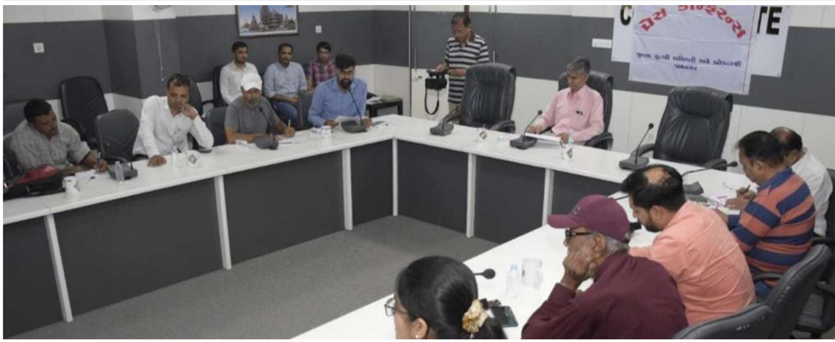
વધુમાં વધુ લોકો મતદાર યાદીમાં નામ નોંધણી, કમી કે સુધારા કરવી શકે તે અંગે લોકોને માહિતી પહોંચી શકે તે માટે મીડિયાની ભૂમિકા મહત્વની છે. હાલની સ્થિતિએ ડ્રાઇફ્ટ રોલ-૨૦૨૩ મુજબ જામનગર જિલ્લામાં કુલ ૧૧,૯૬,૫૪૯ મતદારો નોંધાયેલા છે. જે પૈકી ૬,૧૪,૮૦૦ પુરુષ મતદારો,

૫,૮૧,૭૩૫ સ્ત્રી મતદારો અને અન્ય ૧૪ મતદારો નોંધાયેલા છે. મતદાર યાદીમાં તમામ નામ દાખલ કરવા, કમી કરવા કે વિગતો સુધારા માટે અરજી કરી શકાશે. મતદાર યાદીમાં પ્રથમ વખત જ નામ દાખલ કરી નવા મતદાર તરીકે નામ નોંધણી કરવા માટે ફોર્મ નં.૬, મતદાર યાદીમાંથી મૃત્યુના કારણે નામ કમી કરાવવા કે નવા દાખલ કરનાર નામ સામે વાંધો લેવા માટે ફોર્મ નં.૭, રહેઠાણનું સ્થળાંતર, મતદાર યાદીની વિગતોમાં સુધારા માટે, જુનું ઊંડોઈ બદલાવવા માટે કે દિવ્યાંગ મતદાર તરીકે નોંધ કરાવવા માટે ફોર્મ નં.૮ ભરી શકો છો. તેમજ ચૂંટણીકાર સાથે આધાર કાર્ડ લિંક કરવા માટે ફોર્મ નં.૬-૫ ભરી શકો છો. મતદાર યાદીમાં કોઈપણ પ્રકારના ફેરફાર કરવા Voter Helpline Mobile App 'u, www.nvsp.in, તથા www.voterportal.eci.gov.in, www.voters.eci.in વેબસાઈટ દ્વારા ઘરબેઠાં ઓનલાઈન જ ફોર્મ ભરી શકાશે. જામનગર જિલ્લામાં લાયકાત ધરાવતા તમામ યુવાઓ પોતાનું નામ મતદાર યાદીમાં દાખલ કરે તે માટે કલેક્ટર દ્વારા અપીલ કરવામાં આવી હતી. પત્રકાર પરિષદમાં નાયબ જિલ્લા ચૂંટણી અધિકારી ઝીવ તેમજ મીડિયા પ્રતિનિધિઓ હાજર રહ્યા હતા.